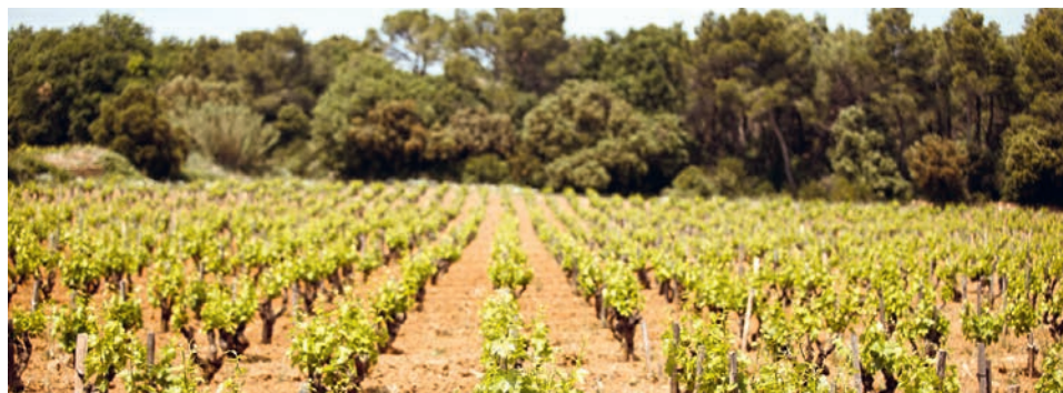
Rebberg des Château des Tours

* Rarität, Bestellung können nur unter Vorbehalt entgegengenommen werden. Rareté, commandes ne peuvent être acceptées que sous réserve.