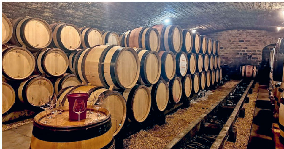
Traditioneller Barriquekeller der Domaine Sirugue