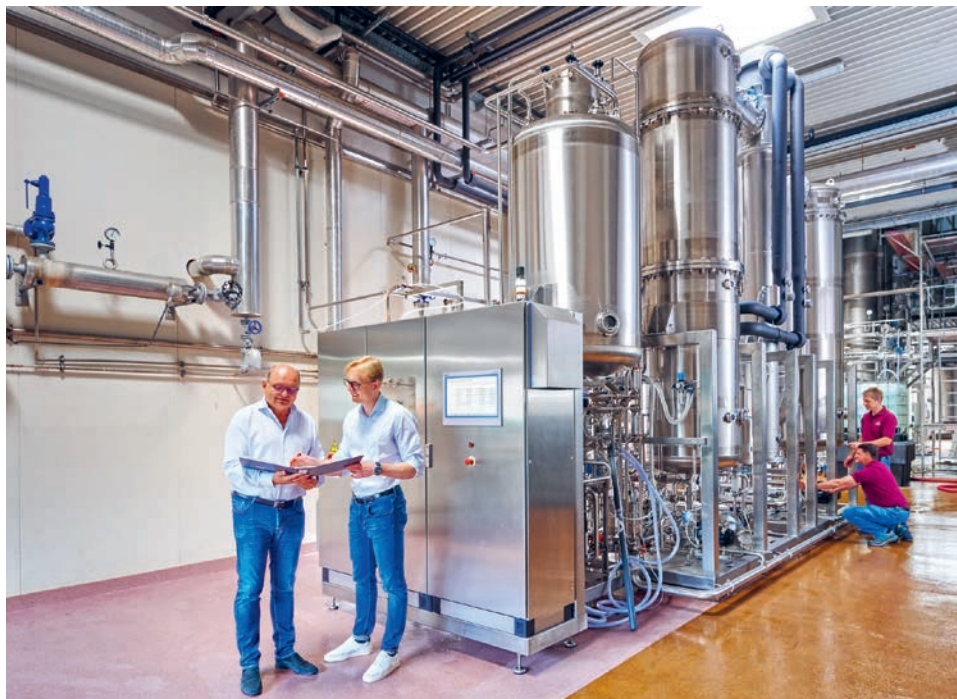
Anlage zur Entalkoholisierung der Weine