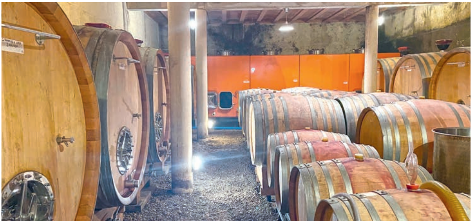
Keller der Domaine Mas Jullien

** verfügbar ab Mai 2026 / disponible à partir mai 2026