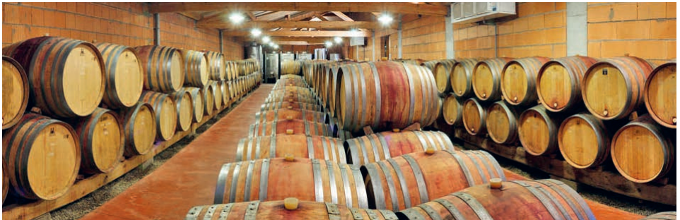
Keller der Maison André Perret

** verfügbar ab April 2026 / disponible à partir d'avril 2026