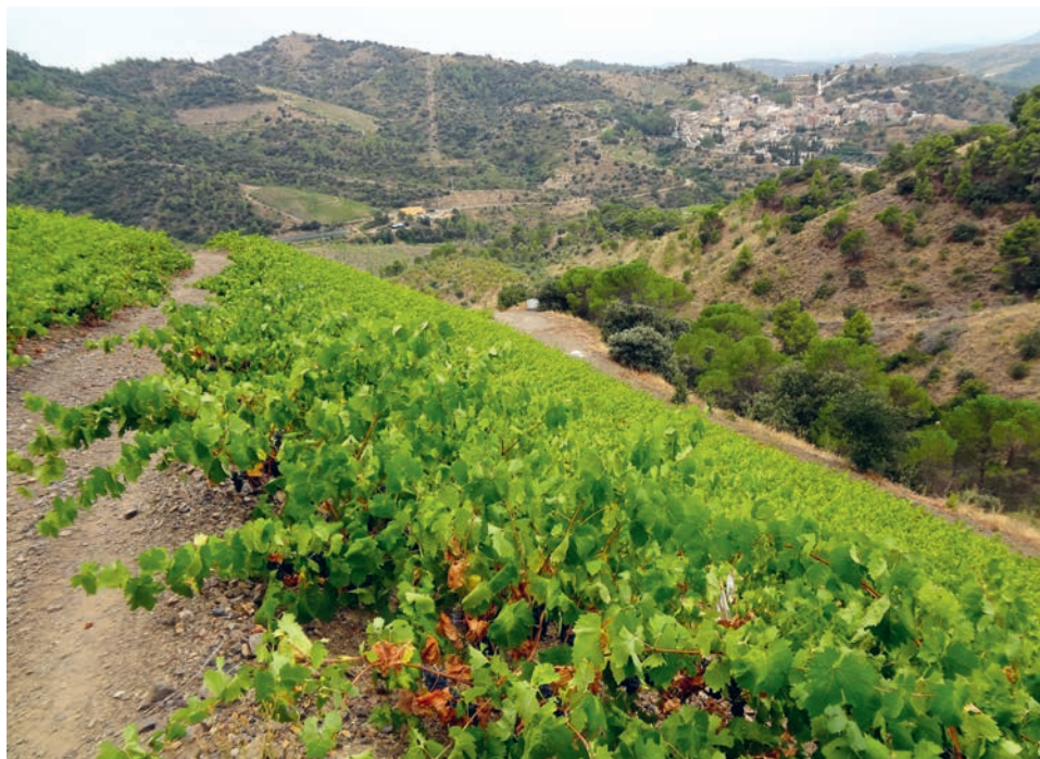
Rebberge im Priorat von L'infernal