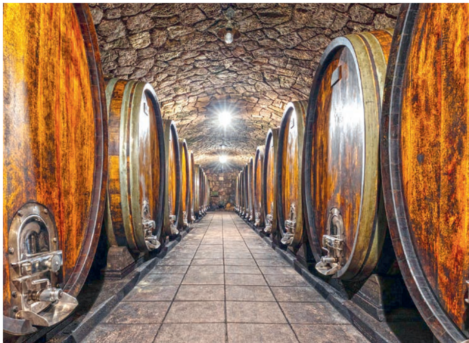
Grosse Holzfässer des Weinguts Umathum