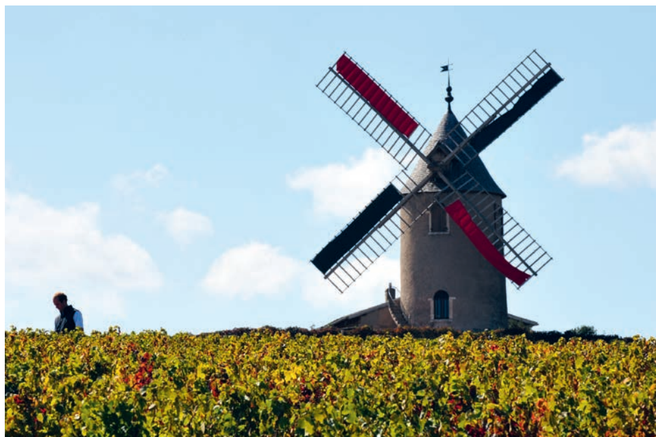
Historische Mühle über dem Weinberg Le Clos der Domaine Labruyère

AOC 2018 75 cl ☞ ▷ 2034 55.00 AOC 2022 75 cl ☞ ▷ 2038 55.00