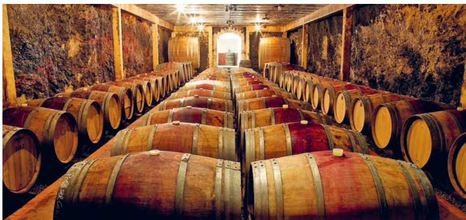
Barriquekeller des Château Revelette