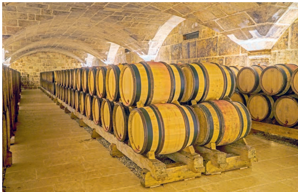
Keller der Domaine Jean-Louis Chave

* Rarität, Bestellung können nur unter Vorbehalt entgegengenommen werden. Rareté, commandes ne peuvent être acceptées que sous réserve.