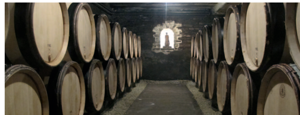
Keller – Domaine Patrick Javillier