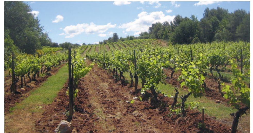
Reberg - Château Revelette