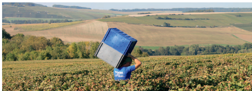
Ernte 2024 - Éric Taillet