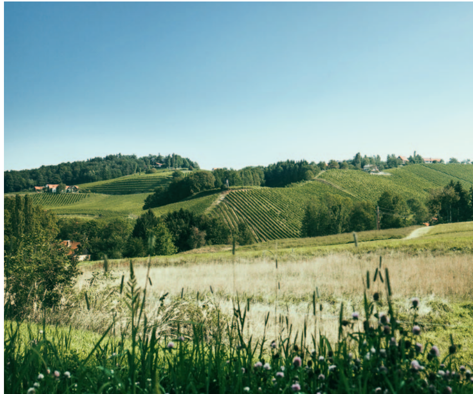
Rebberg «Nussberg» - Weingut Gross