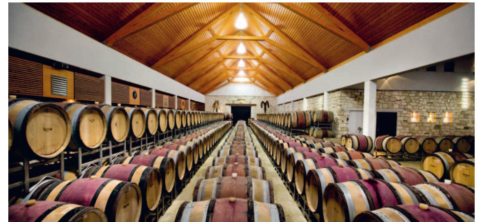
Keller - Weingut Umathum