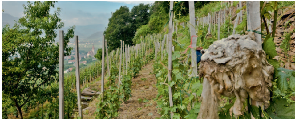
Rebberg - Weingut Prager