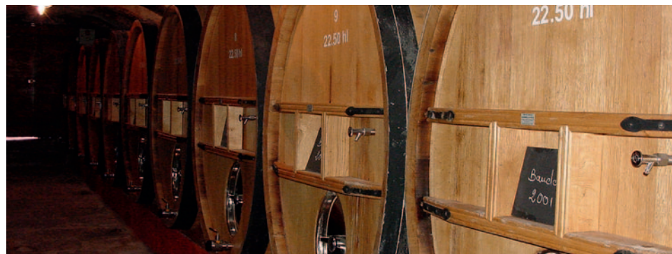
Keller - Château Vannières