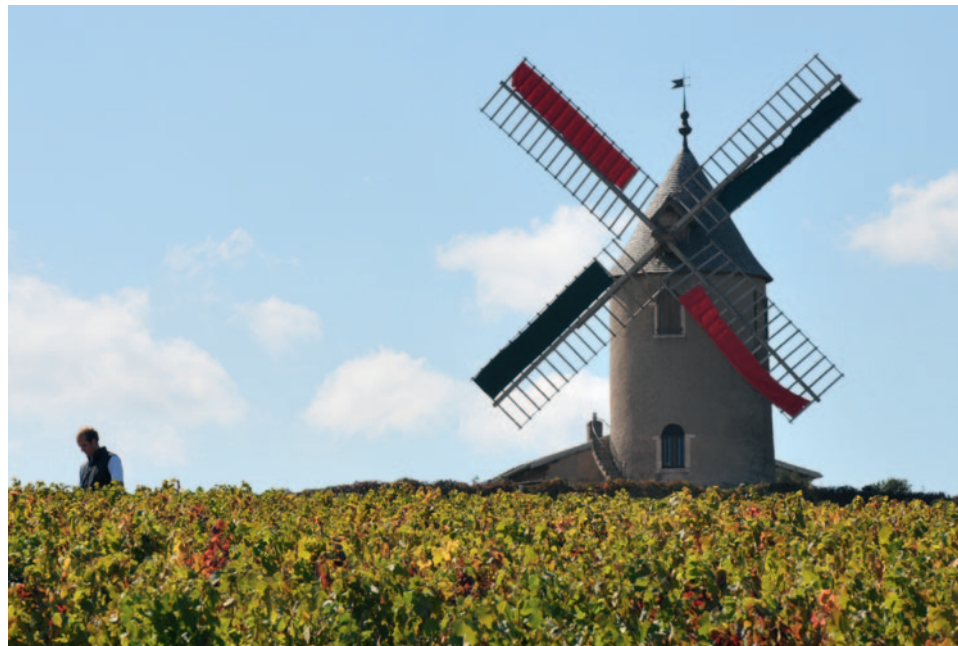
Rebberg «Le Clos» - Domaine Labruyère