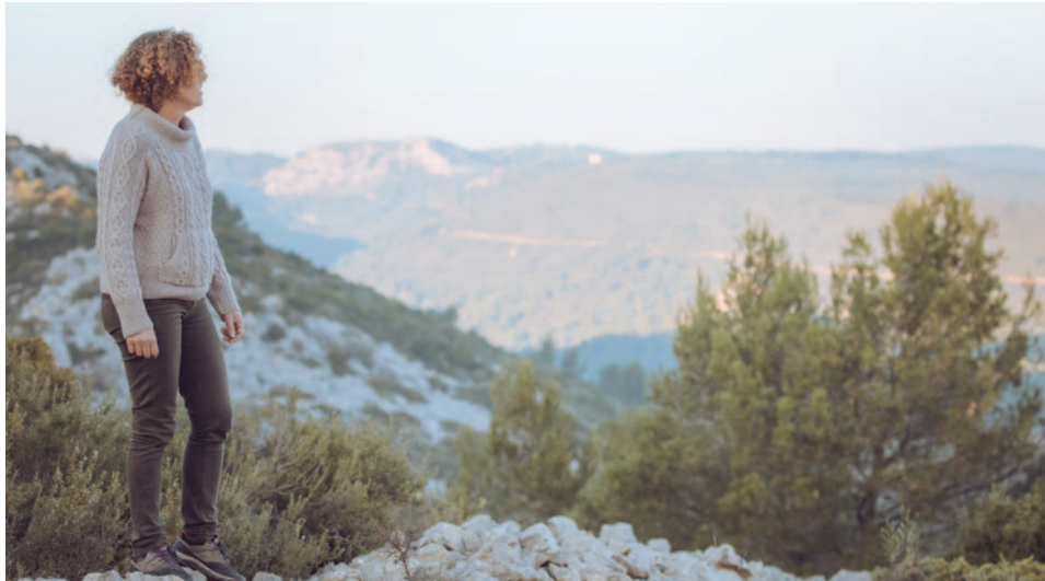
Magali Roux - Domaine des 2 Ânes